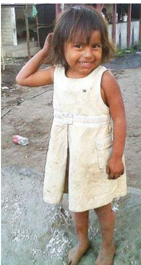
Niñas del albergue Simón Bolívar en Quesería, Colima

Gracias a estas instituciones por unirse y trabajar por la causa Emalur: