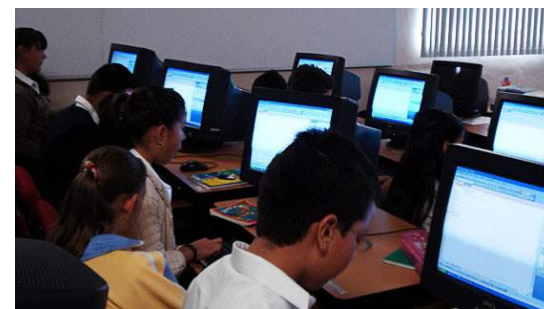
Clase en el centro comunitario de cómputo Quesería