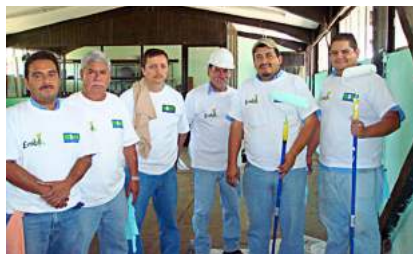
Trabajo del voluntariado Quesería