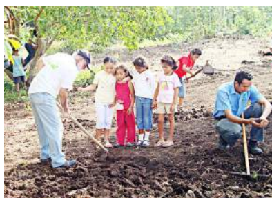
Actividades durante la semana cultural