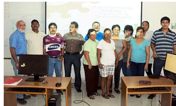
Clase en el comunitario de cómputo San Rafael