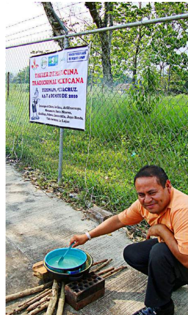
Taller de herbolaria