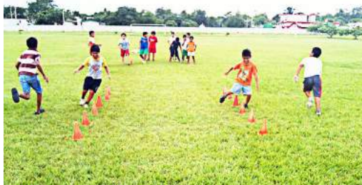
Entrenamiento durante una clase del taller de fútbol Centro Comunitario San Rafael. Javier Rojo Gómez, Chetumal