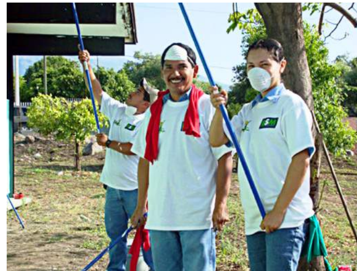
Actividades en Quesería, Colima y Tezonapa, Veracruz