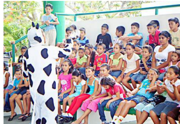
Actividades de juegos cooperativos y cuentacuentos