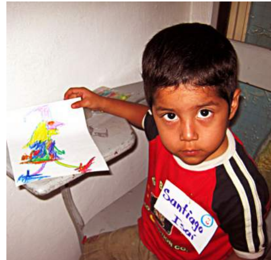
Actividad de cuentacuentos