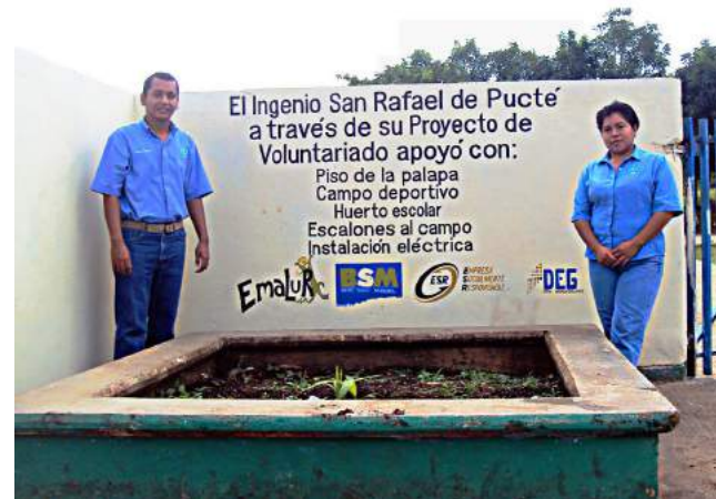
Actividades del Voluntariado San Miguel

"Que no cuesta nada ponerte al servicio de los demás únicamente depende de cada uno de nosotros y tener ganas de ayudar"