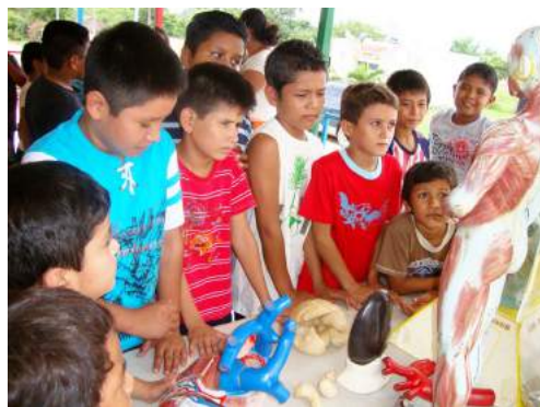
Actividades de pintura mural y tren de la ciencia

“Me pareció muy bien, de hecho la mejor parte de la semana fue la pintura mural, aunque considero que no nos involucramos lo suficiente como Ingenio, pero el programa es excelente”.