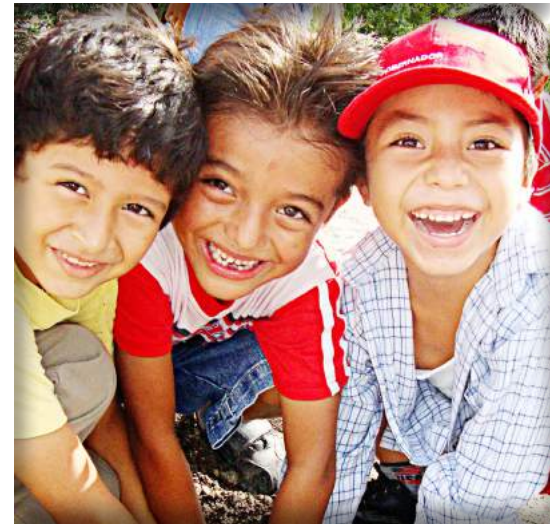
Alumnos de la escuela Gonzalo Guerrero durante el Voluntariado San Rafael. Javier Rojo Gómez, Chetumal