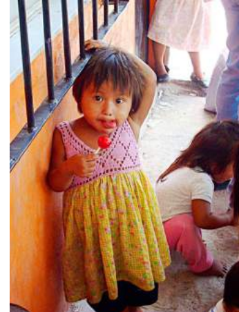
Niños de los albergues en Quesería, Colima

El equipo de Emalur valora los logros alcanzados y se entusiasma con las metas a futuro. Nos motiva el pensar que los beneficios de los proyectos puedan llegar a un mayor número de personas cada año. Porque en el tiempo vamos trazando el camino con la fortaleza renovada, entregando lo mejor de nosotros.