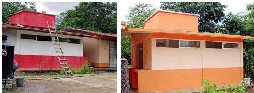
Antes, después del Tebachillerato Laguna Chica

Se instalaron 6 computadoras con Internet para brindar el servicio de investigación y apoyo a tareas.