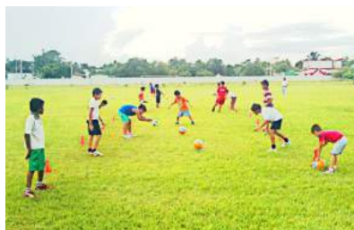
Actividades en el centro comunitario San Rafael