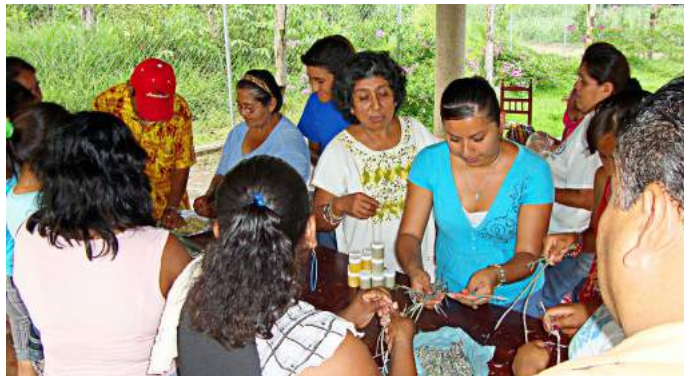
Elaboración de pomadas

Se integró un grupo de 20 voluntarios para apoyar la participación comunitaria y la apropiación de los proyectos.