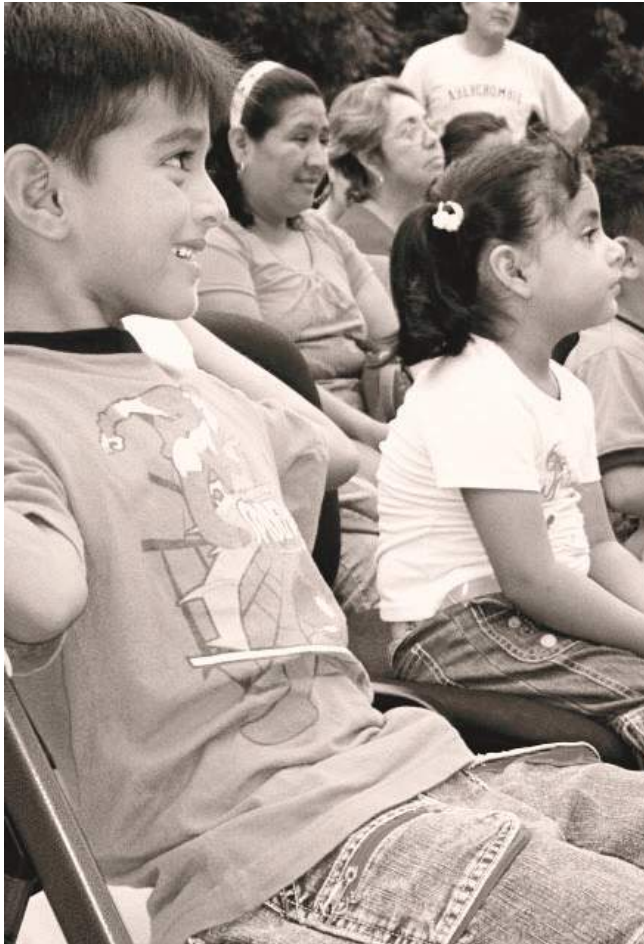
Beneficiarios por año 1997-2010