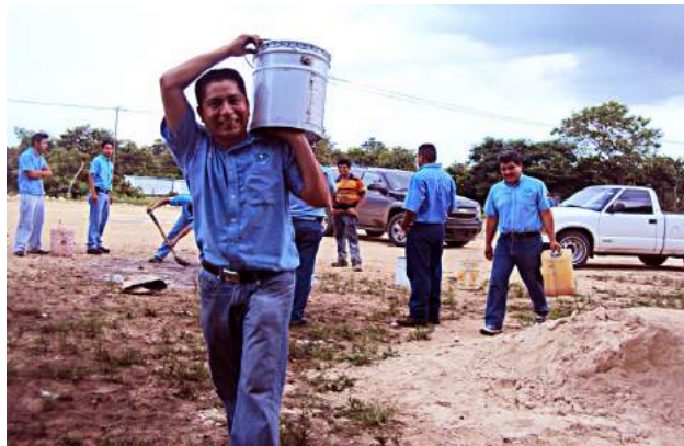
Actividades del Voluntariado San Miguel

"Aprendí a trabajar en equipo, a tener disposición, a ayudar y a hacernos sensibles a lo que nos rodea"