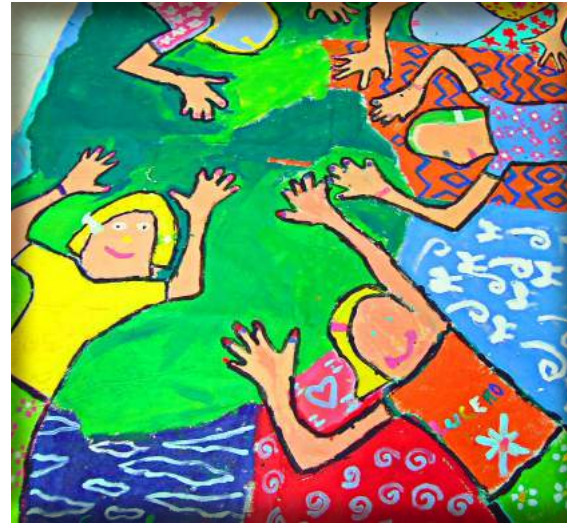
Mural elaborado durante la Semana Cultural en Javier Rojo Gómez, Chetumal

Unidos por la causa Emalur . . . Unidos por la causa Emalur . . .