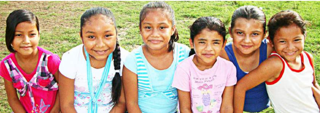
Alumnas de la escuela Gonzalo Guerrero durante el Voluntariado San Rafael. Javier Rojo Gómez, Chetumal