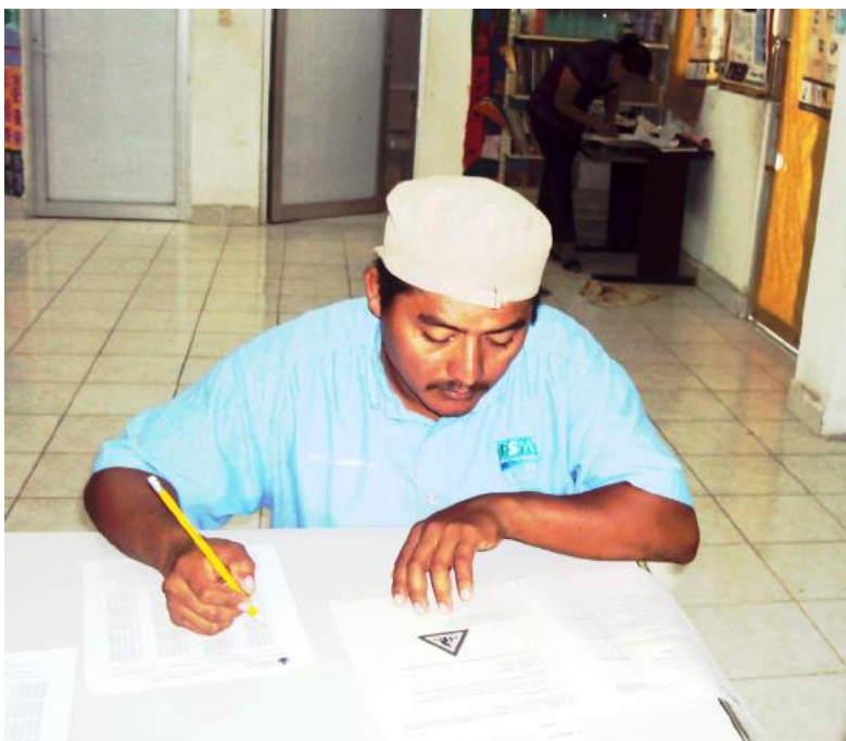
Plaza comunitaria junto con el Instituto Estatal para la Educación de Jóvenes y Adultos IEEA, en el Ingenio San Rafael de Pucté

En el 2012 se beneficiaron 60 jóvenes y adultos en educación abierta en los tres niveles básicos y recibieron certificado 6 personas.